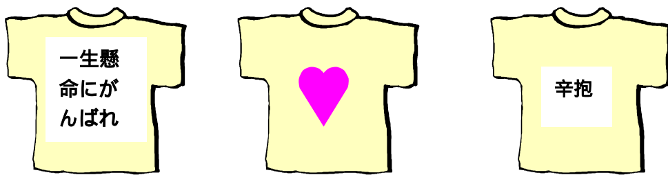
親がかいた「我が背を見よ」のTシャツ

お父さんの背中が泣いているように見えたとき、笑ったように見えたとき、恐いと感じたとき、・・・そんなことも、子どもに聞いてみたいですね。