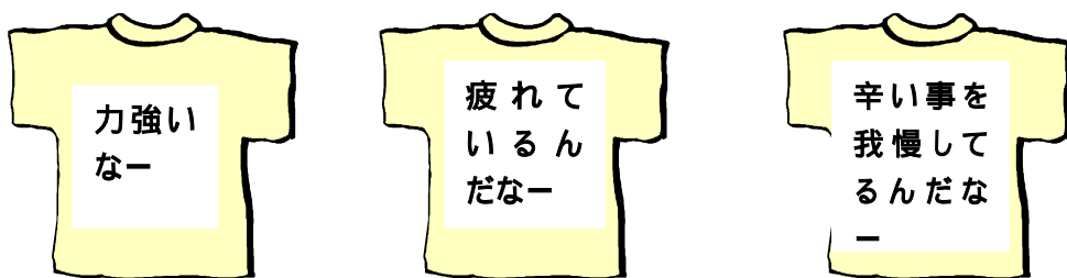
子どもがかいた「親の背にみたもの」のTシャツ